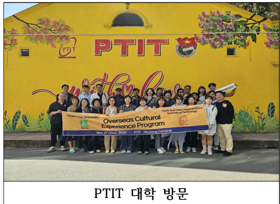
PTIT 대학 방문