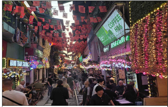
하노이 기차길 풍경

4) 호찌민 생가 및 광장 : 베트남 독립의 아버지 호찌민 주석의 검소한 삶의 흔적이 남아있는 곳입니다. 인민의 지도자로서 평생을 조국통일을 위해 헌신했던 그의 정신을 엿볼 수 있습니다. 광장은 베트남의 독립 선언이 이루어진 역사적인 장소입니다.