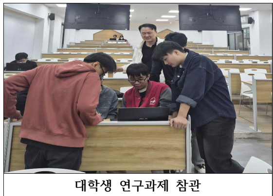
대학생 연구과제 참관